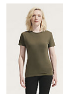
SOL'S REGENT WOMEN